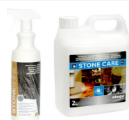
STONE SHINE / STONE CARE