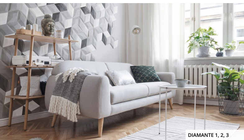
DIAMANTE 1, 2, 3